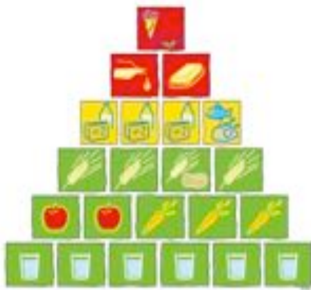
Abbildung 1: tägliche Ernährungspyramide BZfE