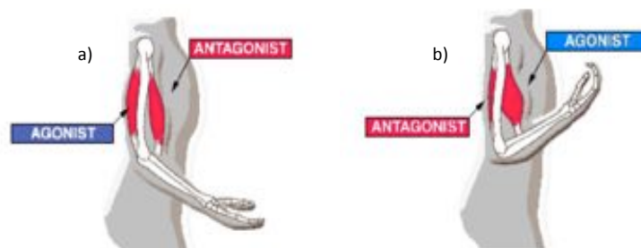
Abbildung 3: Zusammenspiel Agonist und Antagonist bei a) Streckung und b) Beugung

Der Muskel kann sich durch Anspannung und Entspannung beugen oder strecken. Für die Gegenbewegung ist ein weiterer Muskel notwendig. Verkürzt sich der Beugemuskel, wird der erschlaffte Streckmuskel gedehnt (und umgekehrt). Agonist ist der Muskel, der ein Gelenk beugt. Der Antagonist ist der Muskel, der ein Gelenk dehnt.