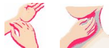
Abbildung 5: Pulsmessung

Am besten geeignet für die Pulsmessung sind die Innenseite des Handgelenks und die Halsschlagader. Praktikabel ist eine Messung über 15 Sekunden. Die gezählten Schläge multipliziert man mit 4 und erhält seinen Puls.